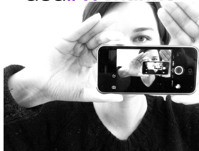
На обложке: «Бесконечность»