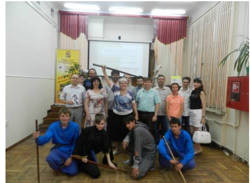
На фото: Участники I Передереевских чтений.