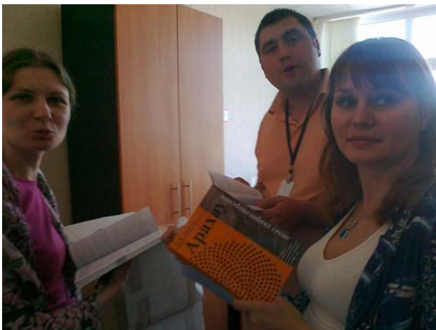
На фото: Презентация учебника Араху в «Российской газете»..

Можно подписаться на учебник Араху. Для этого нужно отправить свой адрес на почту rbardalzo@yandex.ru с пометкой «Учебник».