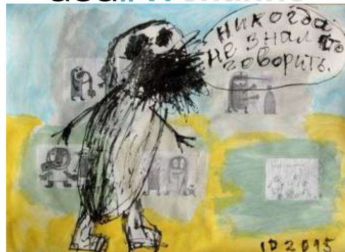
На обложке: работа И. Дубяги «Никогда не знала, что говорить»