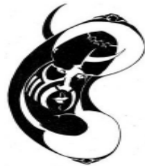
Рис. И. Карасева

Чужое око иногда подобно железным оковам.