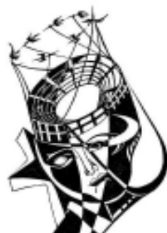
Рис. И. Карасева “Ум”

Время знай всё идёт. И легонько толкает. А дверь ждёт - Непременно войду.