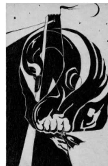
Рис. И. Карасева “Лебедь”