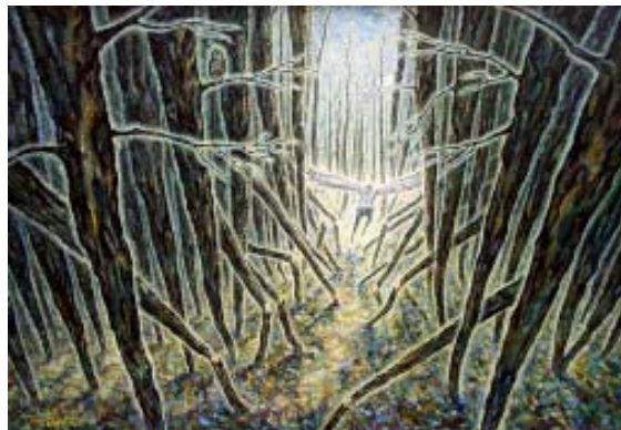
карт. А. Левченко “Полнолуние”