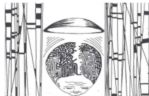
Рис. И. Бедросовой

Засыпал он плохо. А когда заснул, ему приснились неслучившиеся неприятности.