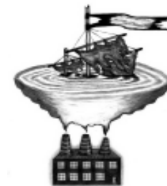
Рис. А. Мамаенко