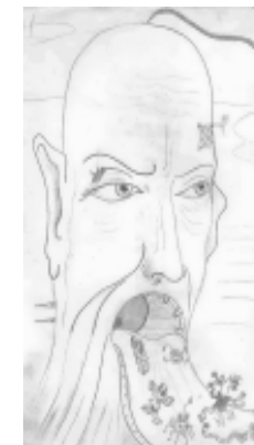
Рис. И. Кротова “Хула”

Миниатюрность формы японского сонета вроде бы вызывает к самодостаточности. В десяти строчках можно сказать всё. Но пресловутая величественность содержания вызывает к продолжению и отражению одного в другом и к выстраиванию связей второго порядка, образующих некий свертхтекст. Отсюда - интуитивная тяга к созданию циклов или диалогических цепочек. Процесс может быть почти бесконечным, поскольку