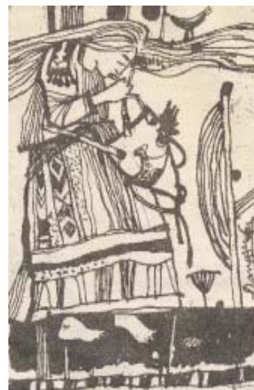
Рис. С. Матушкина “Музыка для глаз”

Тем более краткость востребована русскоязычными авторами сейчас, в век Интернета. Как говорится: «краткость – сестра таланта». Давайте же убедимся в этом сами.