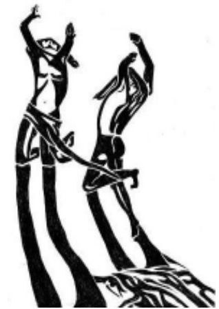
Рис. И. Карасева “Марионетки”

Мой домик, свитый из перьев кецаля, Из жёлтеньких перьев птички-трупьяла, Мой домик, сплетённый из веток коралла, Покину я вскоре. Ай, какой я! Ай-ай-ай!