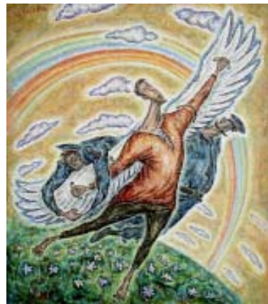
карт. А. Левченко. “Дедалыч”.

Когда последние сомненья в гениальности моей меня покинут, От ближних этот дар я скрою, И лишь наедине с собой, В истоме сладкой после съеденного сала Я буду наслаждаться игрою мыслей мощных и идей оригинальных.