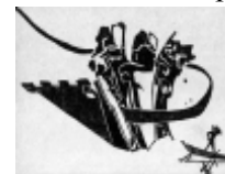
Рис. И. Карасева “Тень”