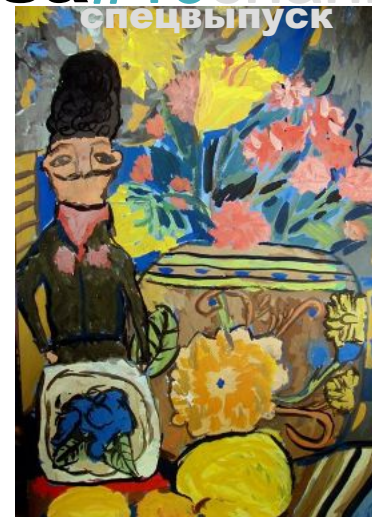
На обложке: работа Валерия Полевого «Казачьи думки».